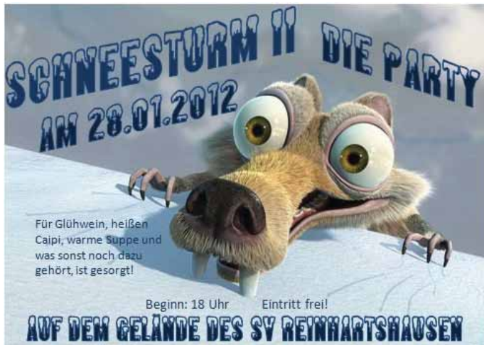
Bei Regen fällt der Schneesturm ins Wasser.

Am Samstag, 28.01.2012 findet ab 18 Uhr auf dem Gelände des SV Reinhartshausen die Schneesturmparty statt. Nachdem die Premiere im Vorjahr, bei besten Wetterverhältnissen und einer großen Schneebear sehr gut angenommen wurde, freuen sich die Organisatoren auf eine Wiederholung in diesem Jahr. Gegen die Kälte helfen Punsch, Suppe und heißer Caiqi, wobei auch Winterkleidung durchaus von Vorteil wäre.