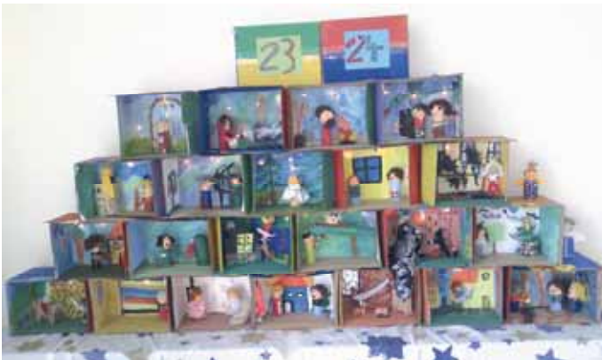
Märchen-Adventskalender der Laurentius-Volksschule Bobingen